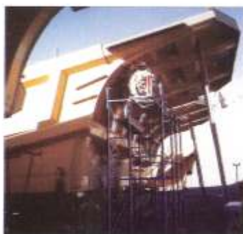
Armado y montaje de caja volcadora Camión CAT 793 C - Industria Minera.