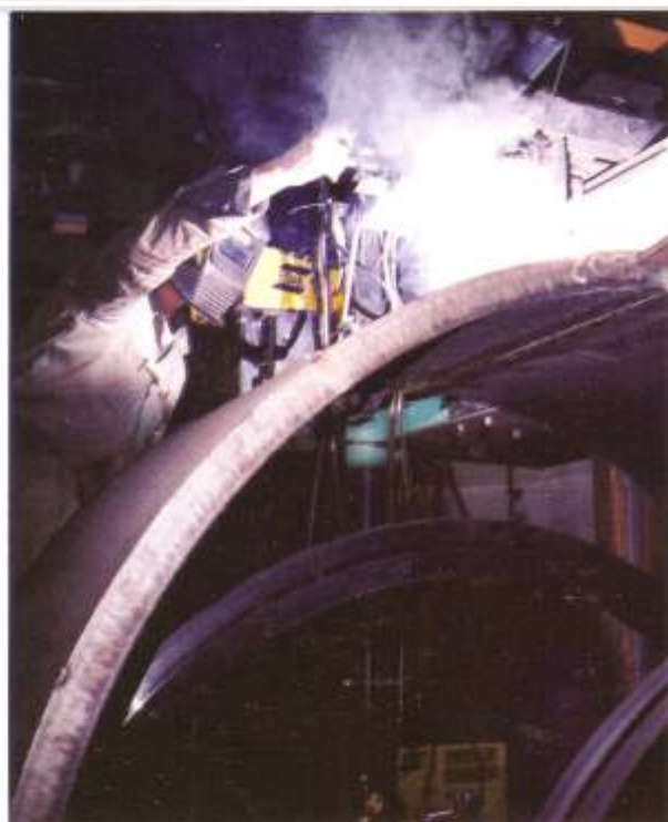
Construcción de virola amasador de barro - Industria Cerámica.