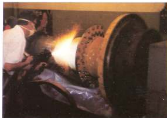
Metalizado por Arco-Spray eje de tren rodante - Industria Minera.