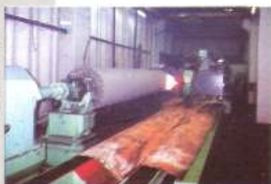
Protección por metalizado por Arco Spray de Rolo Bobinador (trabajo realizado en la planta del cliente) - Industria del Papel.

Para lo cual realizamos el análisis del problema, su diagnóstico y la definición e implementación de la solución más adecuada.