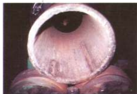
Aporte resistente al desgaste por abrasión, en el interior de caños - Industria Siderúrgica.