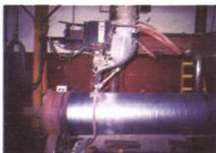
Reconstrucción y protección de tambor de Puente Grúa - Industria Siderúrgica.