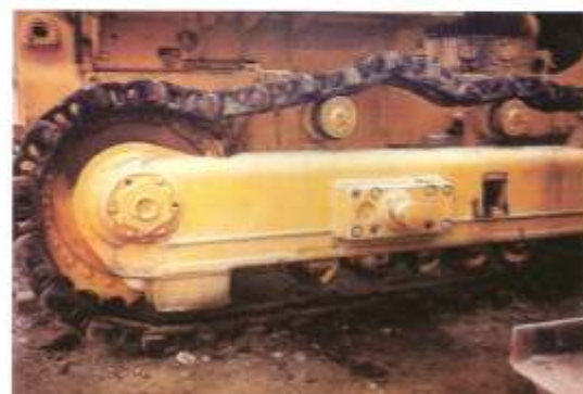
Reparación de cadenas - Industria Vial