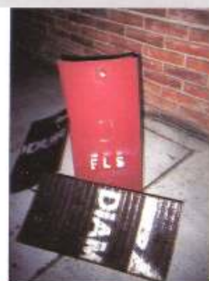
Postizos en chapas bimetálicas, para descarga de granos - Industria Agrícola